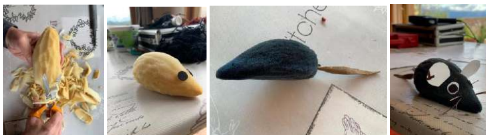
Naissance d'une souris