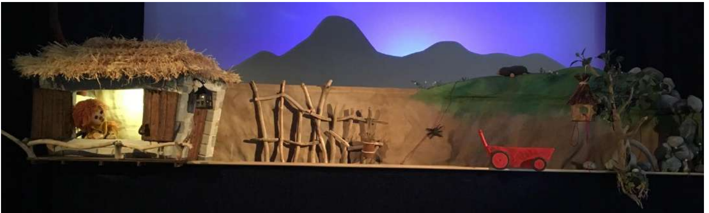
Deux niveaux de jeu : la vallée où vit Barnabé (1 er plan), et la colline (2 ème plan)

Plusieurs espaces scéniques ont été imaginés avec des plans de différentes hauteurs et profondeurs qui permettent le cheminement des marionnettes.