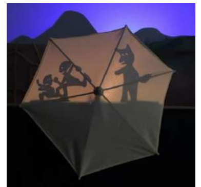
Derrière un parapluie