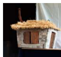
Les étapes de fabrication de la maison