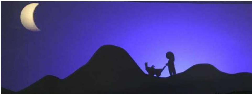
Sur la toile de fond qui représente les montagnes.

Plusieurs emplacements pour développer le théâtre d'ombre