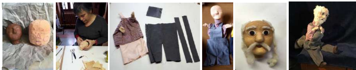
Les étapes de fabrication de la marionnette Barnabé

Marionnettes, décors, accessoires... tout est « Made in Théâtre Talabar »