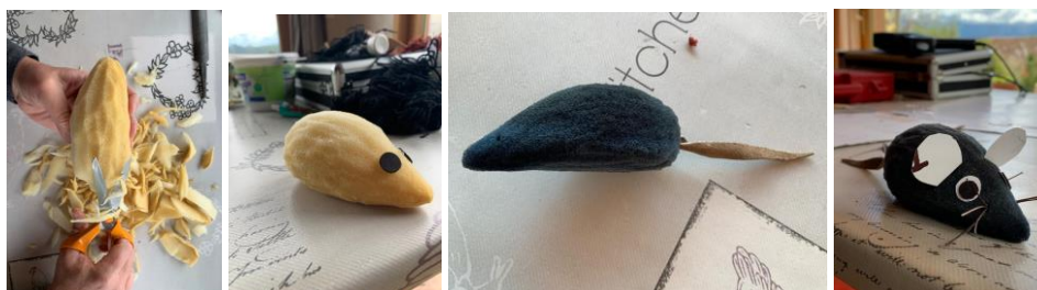
Naissance d'une souris